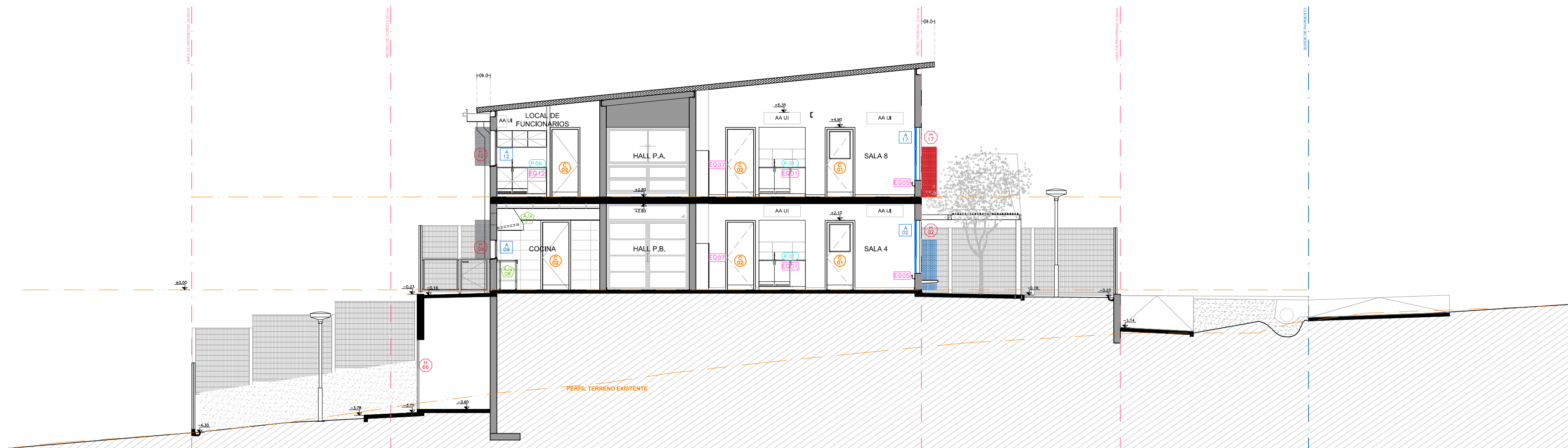
CORTE DD ESC: 1:100